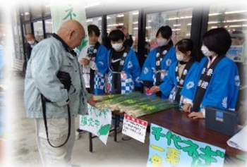
6年生 千代ネギ販売 あいぱんで見事完売