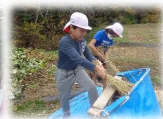
5年生 脱穀 手で丁寧に