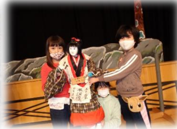
3年生 今田人形体験