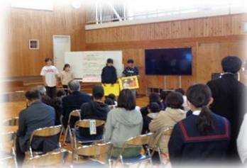
6年生 ふるさと竜東の集い 千栄小についての発表