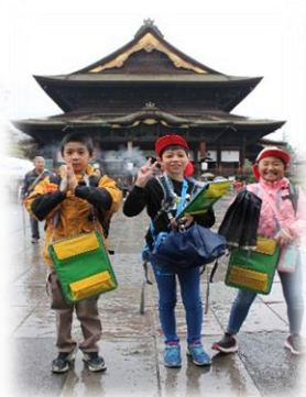
4年生 3校合同 長野社会見学